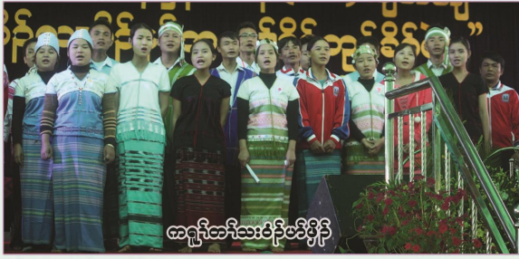
ထက္ကီထီးသီးဝဲဒ်တဲဒ်ဖိုဒ်