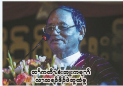
တၢ်တၢ်လဲၤစဲးဆျၢၣ်ထီၣ်လၢသးရဲၣ်ဆျၢၣ်ထီၣ်စ့ၢ်ဒီးအမၤဂၤ