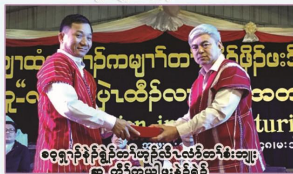
ခဝုၣ်ဂ့ၢ်လံၤကိၤဂၤလၢအဆိၣ်ထွဲတၢ်မၤဒီးဆျၢၣ်ထီၣ်စ့ၢ်ဒီးအမၤဂၤ