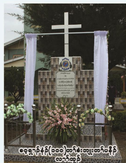
ခဝုၣ်ဂ့ၢ်လံၤကိၤဂၤလၢအဆိၣ်ထွဲတၢ်မၤဒီးဆျၢၣ်ထီၣ်စ့ၢ်ဒီးအမၤဂၤ