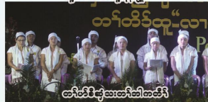
တၢ်တၢ်လဲၤစဲးဆျၢၣ်ထီၣ်လၢသးရဲၣ်ဆျၢၣ်ထီၣ်စ့ၢ်ဒီးအမၤဂၤ