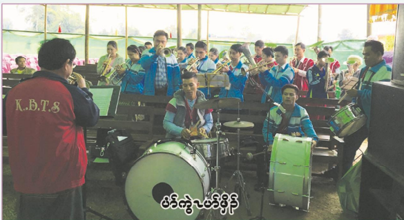
ပံာ်ကျဲၤပံာ်ဖိုၣ်