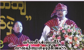
တၢ်တၢ်လဲၤစဲးဆျၢၣ်ထီၣ်လၢသးရဲၣ်ဆျၢၣ်ထီၣ်စ့ၢ်ဒီးအမၤဂၤ

လၢတၢ်ဖဲတၢ်မၤအတၢ်ပံာ်ဖျိတဖၣ် ပနံၤဟူဘၣ်က့ၢ်ပုၤကညီဘျၢထံၣ်ခဝုၣ်ကမံး တံာ်မၤတၢ်အတၢ်ပံာ်ဖျိ, ကျိၣ်စ့အတၢ်ပံာ်ဖျိတဖၣ်, ဝဲၤကျိၤတဖၣ်, ကမံးတံာ်ဂၢ်ကျၢၤ, တၢ်တီၣ်ကျဲၤတဖၣ်ဒီး ပုၤကညီဘျၢထံၣ်လွၢၤဂ့ၢ်ပီၤညါဖျိစိမိၤအတၢ်ပံာ်ဖျိဒီး ပနံၤလၢကမၤသးခု ခဝုၣ်ဂ့ၢ်လံၤကိၤဂၤလၢအဆိၣ်ထွဲတၢ်မၤဒီး ဖူးသးဆျၢၣ်ဒိၣ်ထီၣ်အိၣ်လၢတၢ်မၤသးကိးအဂီၢ်စ့ၢ်ကိးလီၤ.